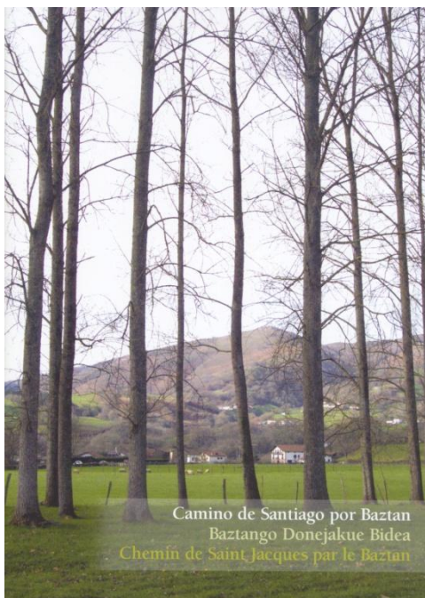
Camino de Santiago por Baztan Baztango Donejakue Bidea Chemin de Saint Jacques par le Baztan