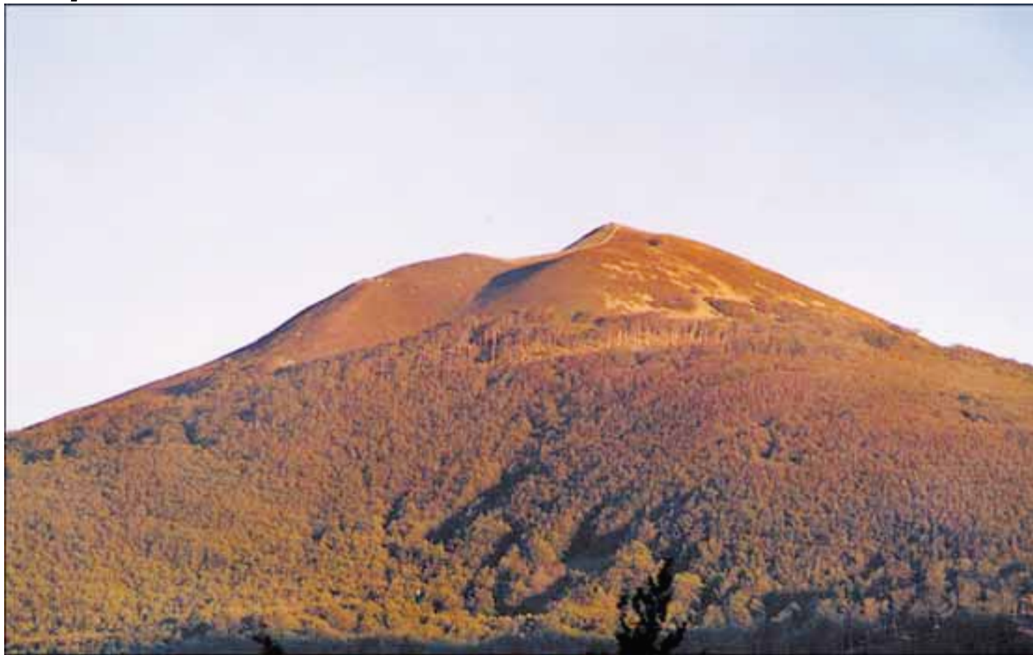
Una vista del monte Adi, cima a la que se asciende entre hayedos y pinares antes de llegar a un último tramo totalmente despejado.

Una sencilla ascensión de poco más de una hora permite llegar a su pelada cima y, allí, contemplar la gran vista existente sobre Alduides y los valles de Erro y Aezkoa