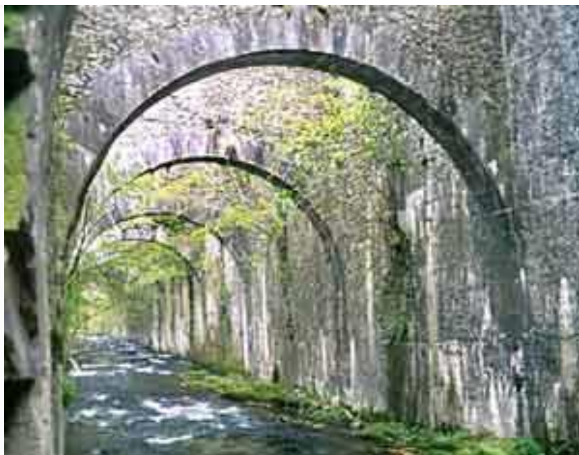
FABRICA DE ARMAS DE ORBAIZETA ORBAIZETAKO OLA, (1784-1884)