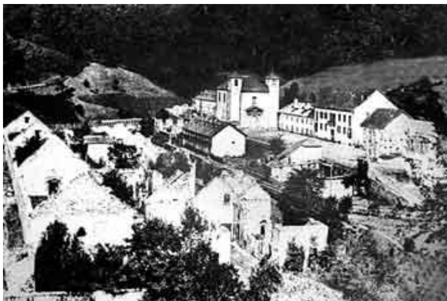
La Fábrica- Ola (1940??)