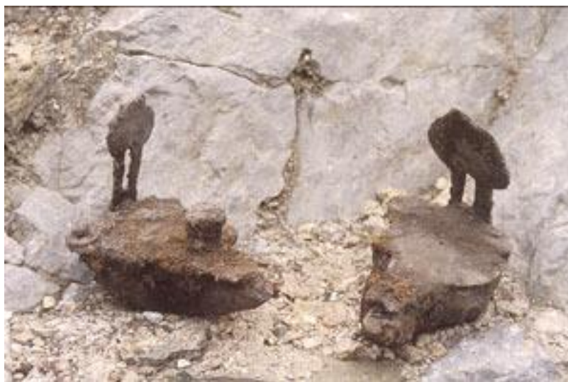
Candiles de la fábrica.