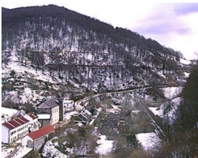
Vista invernal desde el oeste Ola mendebaldetik ikusita