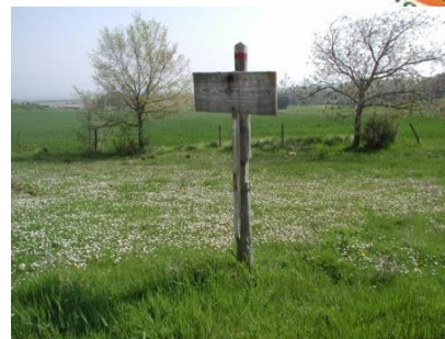
Poste de Peña

En la Tejería encontramos balizas antiguas de la primera señalización, al igual que en el collado de Arangoiti y en Peña.