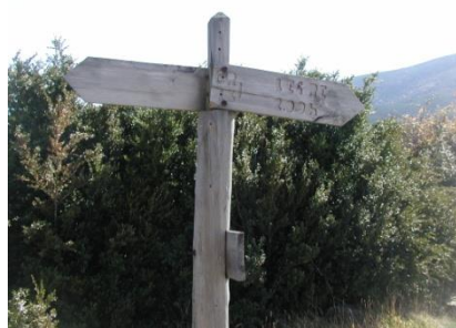
Poste de Tejería