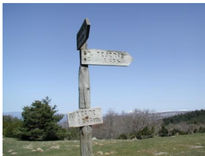
Poste del collado de Arangoiti